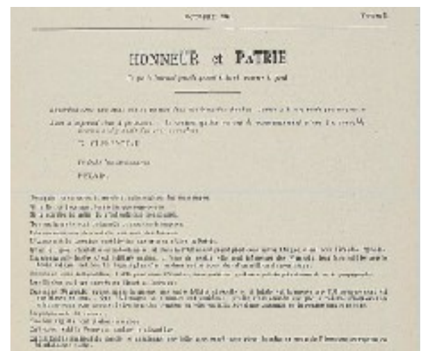
Archives Départementales du Maine et Loire