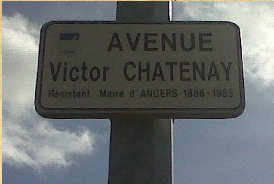
Plaque de sa rue située à Angers