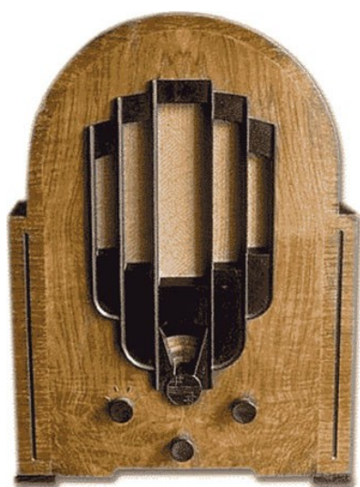
Radio TSF (Télégraphie Sans Fil)