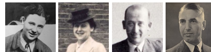
Peter van Pels, Augusta van Pels, Herman van Pels, Albert Dussel, mère de Peter père de Peter dentiste

« La lecture, l'étude et la radio, voilà nos seules distractions »