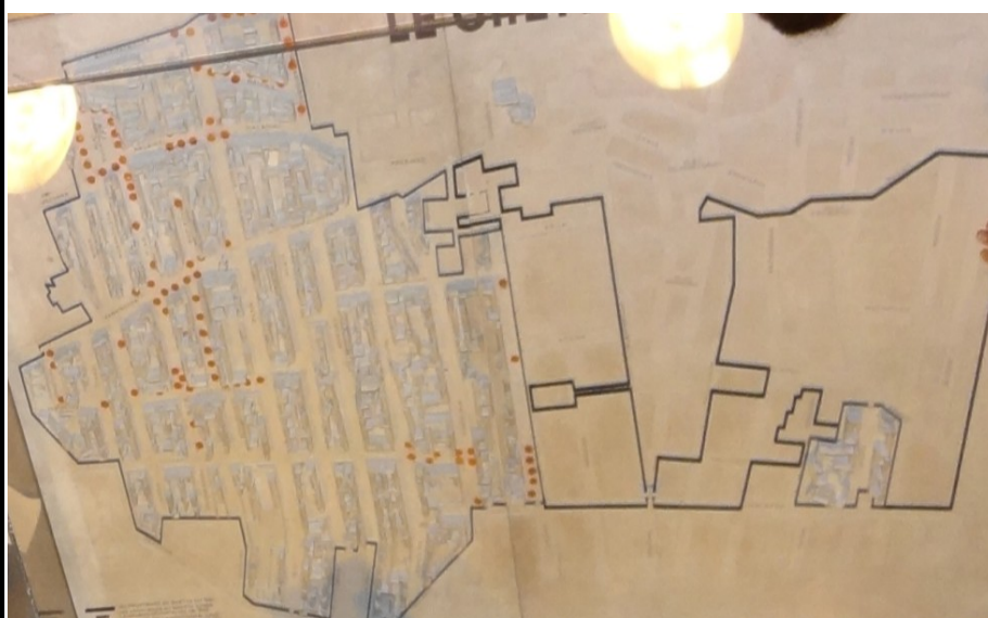
Maquette du Ghetto de Varsovie

Entré clandestinement dans le ghetto de Varsovie, Karski a également pénétré dans le camp de concentration d'Izbica près du camp d'extermination de Belzec. « A ce stade, ils étaient complètement déshumanisés. J'étais obligé, de faire un effort de volonté pour ne pas m'enfuir et pour me convaincre que je n'étais pas un de ces malheureux condamnés . Pour nous, c'était la guerre et l'occupation, pour eux juifs polonais c'était la fin du monde » a dit Karski après son infiltration dans le camp de concentration d'Izbica.