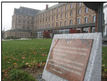
Grand séminaire, rue Barra ( Angers)