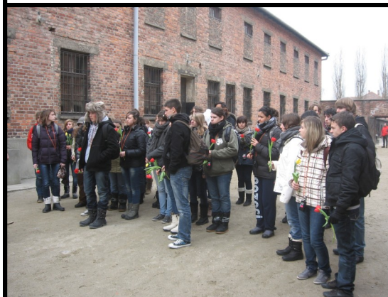
Auschwitz I, camp de concentration 08 février 2011 (38 élèves du voyage en car).

Henri Borlant est Chevalier de la Légion d'honneur.