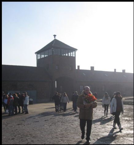
Auschwitz II Birkenau, camp de d'extermination. 10 février 2011 (38 élèves du voyage en car).