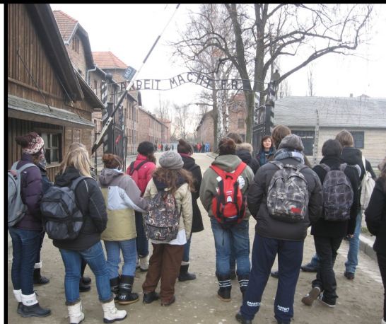
Auschwitz I, camp de concentration 08 février 2011 (38 élèves du voyage en car).

Aujourd'hui, chacun de nous contribue à la Mémoire avec cette exposition publique.