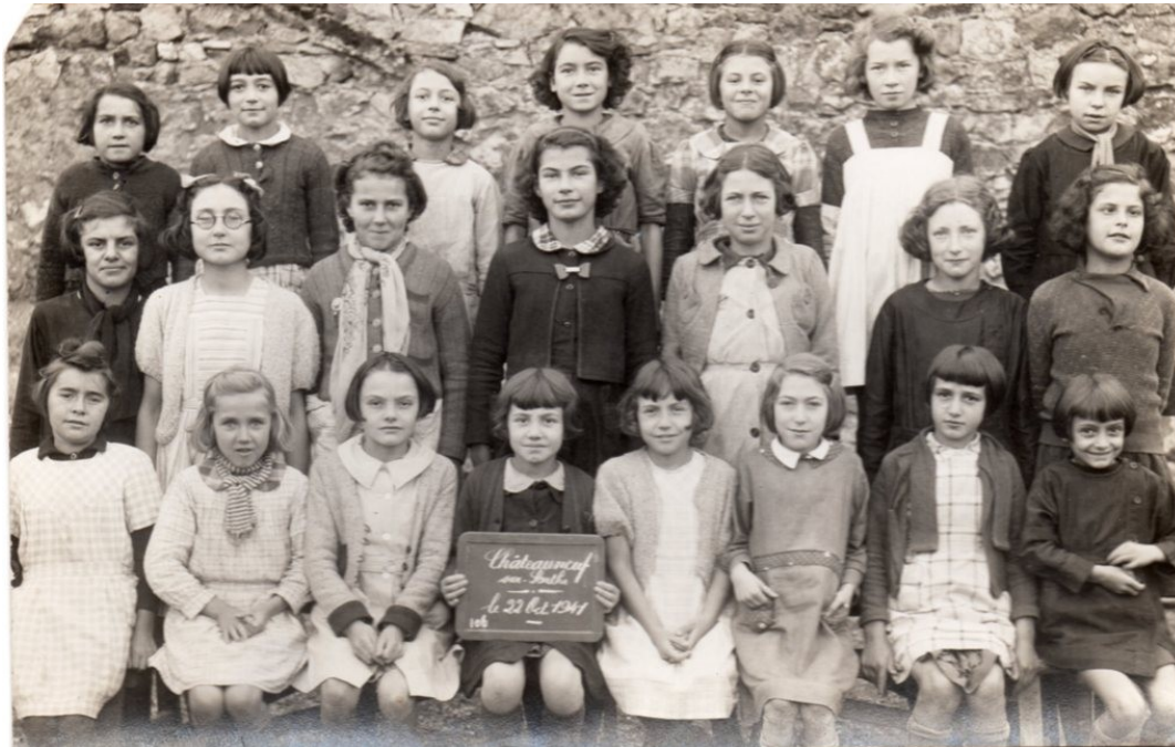
Photo de classe