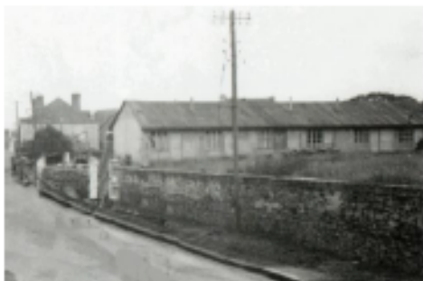
Baraquements, rue Nationale

La guerre t'a parquée dans ta baraque grise, Etroite et alignée, ni maison, ni remise, En plein cœur de la ville, un matin de printemps, Sur le bord de la rue, ouverte à tous les vents.