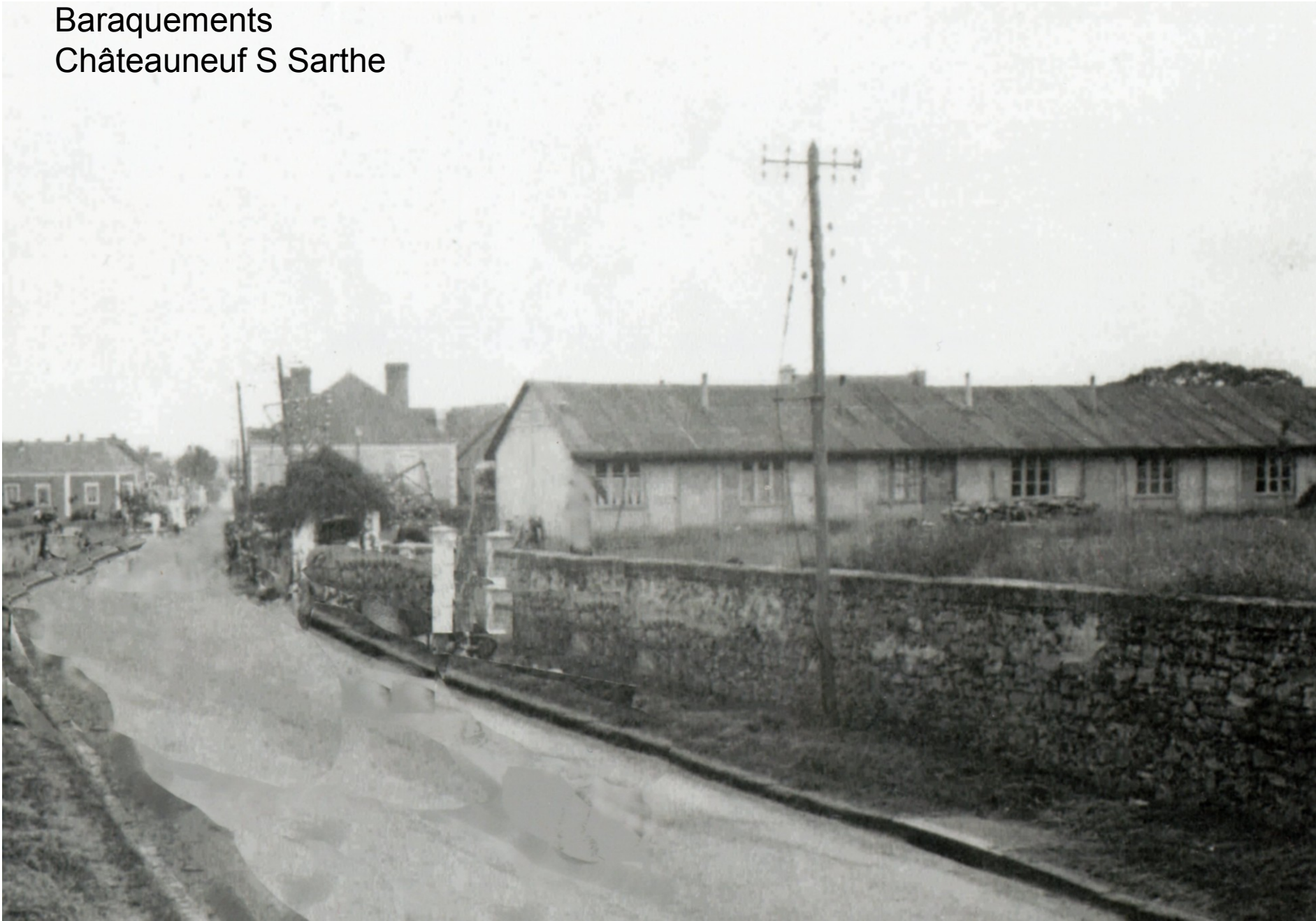
Baraquements Châteauneuf S Sarthe