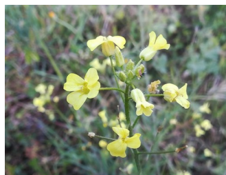
Silvestre rapum, fleur de rave sauvage

La graine de la rave sauvage, Mélangée a de la farine d'ers, d'orge, de blé et de lupin, Unifiera votre peau