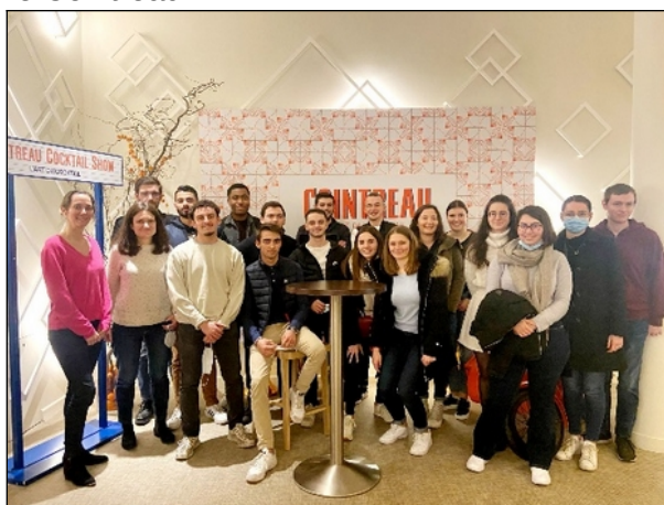
Visite du Carré Cointreau par les étudiants de 3 e année le 25 février 2022

La TA permet la prise en charge partielle des frais afférents à diverses sorties pédagogiques. L'an passé, les étudiants ont pu aller au cinéma dans le cadre du partenariat DCG-STMG, ou encore visiter le Carré Cointreau.