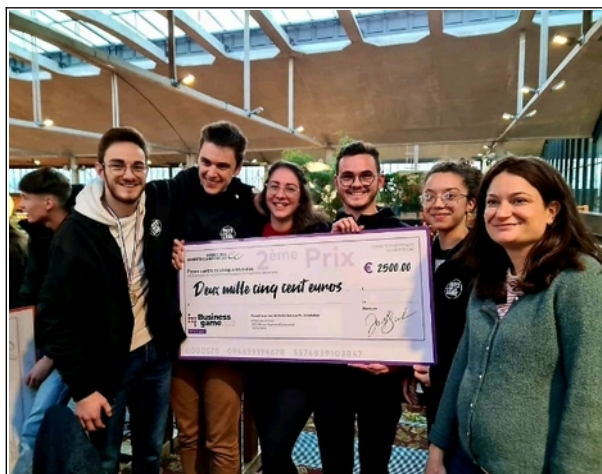
Remise des prix à l'équipe de DCG3 lors de la Finale nationale du Business Game organisé par l'Ordre des Experts-comptables à Paris le 9 décembre 2023

Chaque année, les étudiants de 2 e année gèrent une entreprise à travers un Business Game organisé sur plusieurs semaines. L'accès à la plateforme est financé par la TA. Ce temps d'apprentissage ludique met en application les compétences acquises, et prépare au Tournoi de Gestion de l'Ordre des Experts-Comptables. En 2022, une équipe de Bergson est arrivée 2 e à la Finale Nationale !