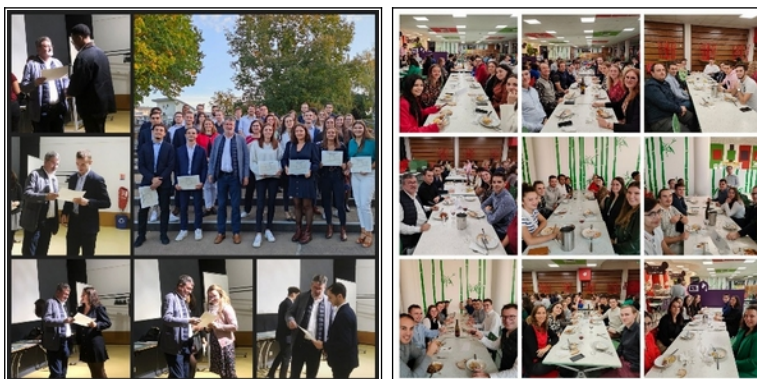
Cérémonie de remise de diplômes de la promo 2022 et Dîner des anciens le 7 octobre 2022