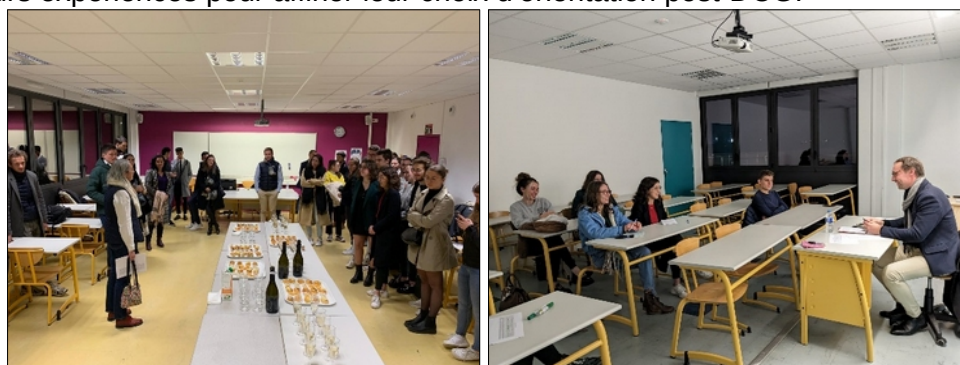
Forum des anciens du 15 décembre 2022